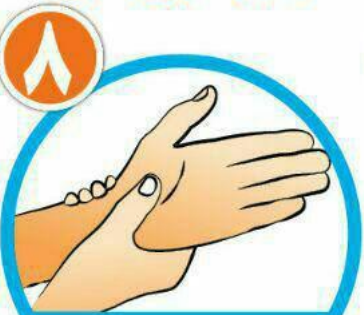
دور مچ هر دو دست را بشویید.