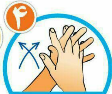
بین انگشتان را از روبرو بشویید.