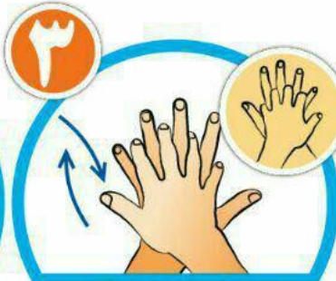
بین انگشتان را در قسمت پشت بشویید.