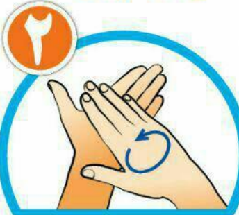
کف دست ها را با هم بشویید.