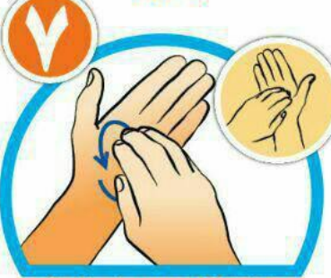
خطوط کف دست را با نوک انگشتان بشویید.