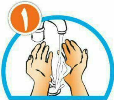
دست ها را خیس کرده و بعد آن ها را صابونی کنید.