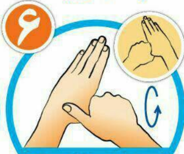
شست ها را جداگانه و دقیق بشویید.