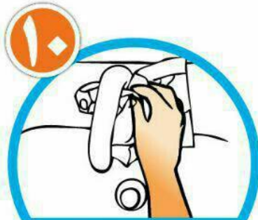
با همان دستمال شیر آب را ببندید و دستمال را در سطل زباله بیاندازید.