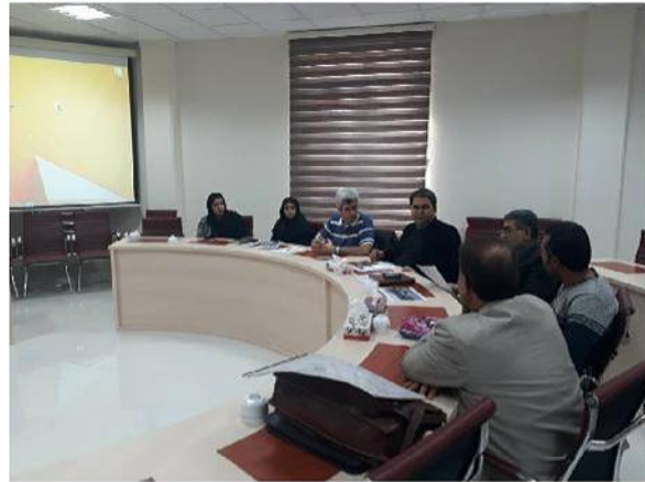
تصویر ۲: جلسه بررسی نقشه‌های نما

یکی از چالش‌های فرایند طراحی و ساخت ساختمان‌ها، مداخله کارفرما به‌عنوان سرمایه‌گذار و رابطه او با عوامل پروژه است؛ چراکه کارفرما برای خود اختیارات زیادی قائل است و این موضوع بعضاً منجر به تنش با طراحان و عوامل ساخت می‌شود و می‌تواند یکی از