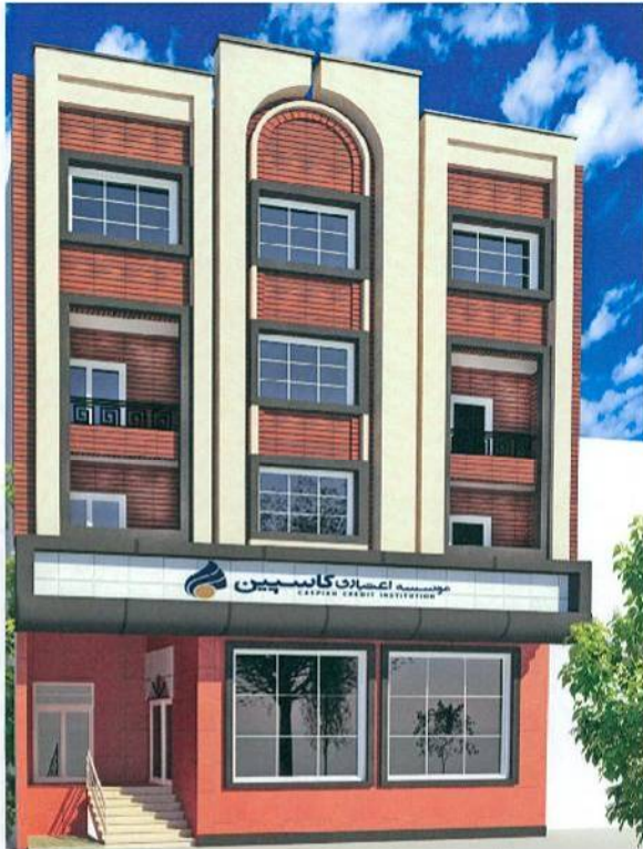
تصویر ۴: نمونه نقشه‌های سه بعدی

تجهیزات و تأسیسات نمایان مد نظر قرار می‌گیرند. نکاتی که کمیته در بررسی نقشه‌ها و اسناد ذکر شده به آن‌ها توجه می‌کند، عبارت‌اند از: مسائل اقلیمی، چشم‌انداز، تأثیر عوامل محیطی با ارزش، محورهای شکل گرفته و هم‌جواری‌ها، بافت با ارزش تاریخی، خط آسمان، انسجام بافت، عناصر طبیعی مانند درخت و رابطه میان درون و بیرون ساختمان و مفاهیم و معانی مرتبط با انسان و محیط.